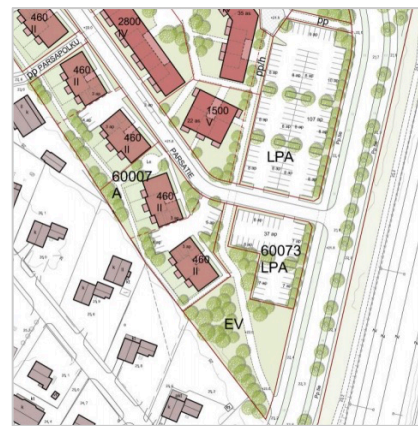
Puiston korvaaminen parkkipaikoilla ja taloilla