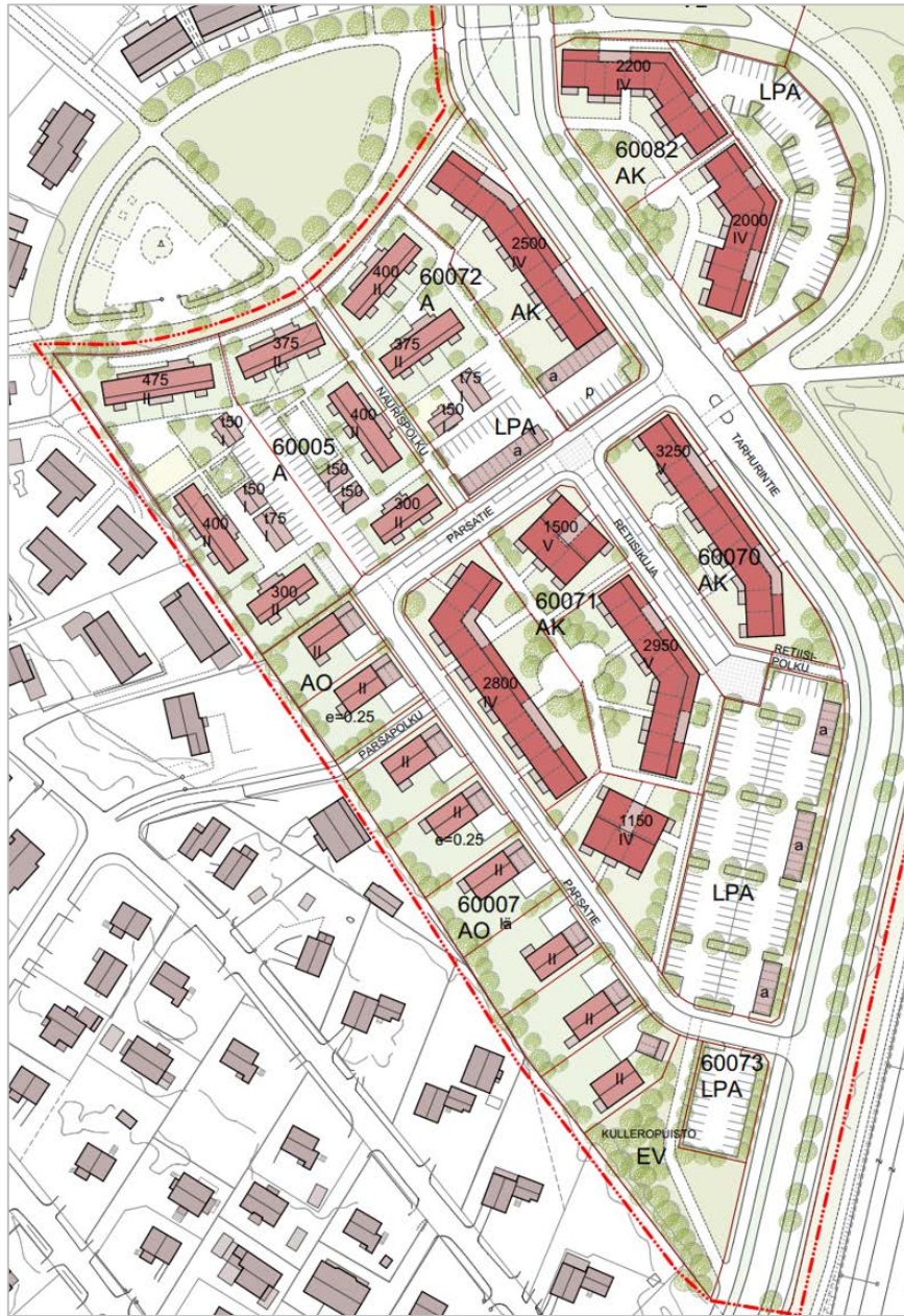
Lautakunnan käsittelyssä 2018 oleva ehdotus