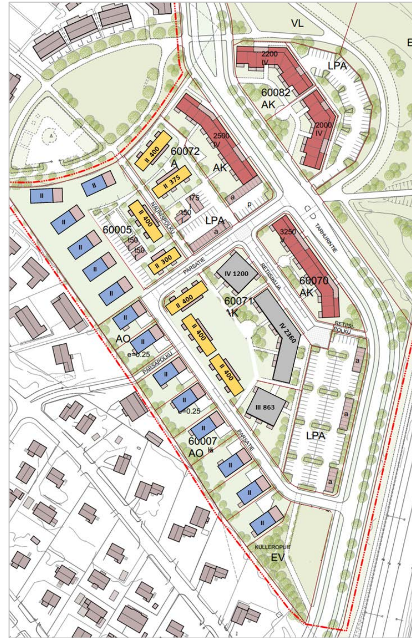
Asukkaiden kesän 2016 ehdotus